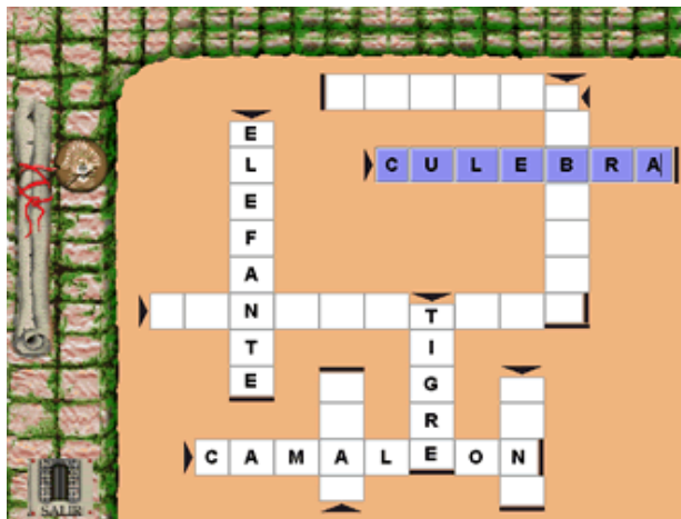
Figura 1a. Crucigramas infantiles, uno de los acertijos de Mente Creativa

Esta idea nos llevó a producir ambientes altamente relevantes para niños, que fueran excitantes y que pudieran sacar máximo provecho de la interactividad del computador. El conjunto de ellos conforma el paquete Enigmática [xvi], que incluye un Editor de acertijos idiomáticos verbales y lógico-perceptuales, llamado Mente Creativa [xvii] y tres juegos interactivos del tipo acertijos operacionales, llamados El viaje de los marcianos [xviii], Náufragos en el polo [xix] y El baúl de los juguetes [xx]. Las siguientes imágenes muestran algunas de las interfaces de estos acertijos: