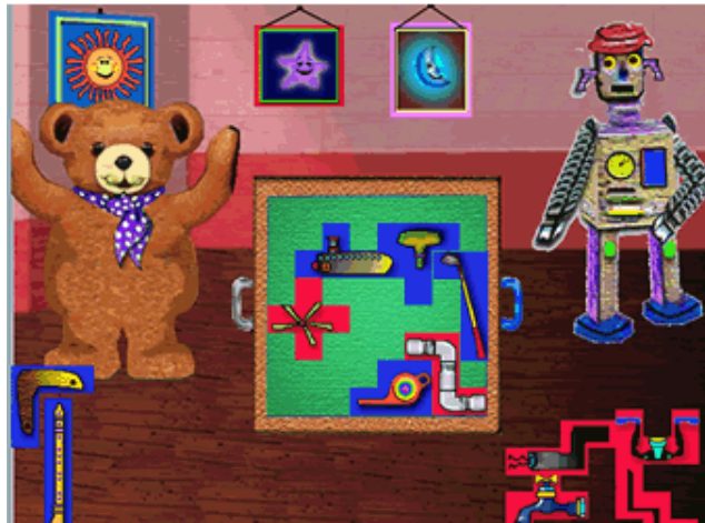
Figura 2a. Interfaces de los juegos, El Baúl de los Juguetes [op.cit]