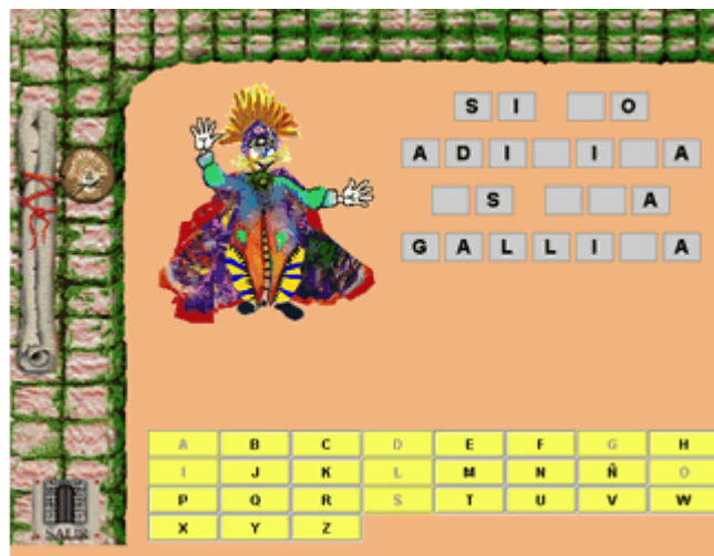
Figura 1b. Adivine la frase, otro de los acertijos de Mente Creativa

Esta idea nos llevó a producir ambientes altamente relevantes para niños, que fueran excitantes y que pudieran sacar máximo provecho de la interactividad del computador. El conjunto de ellos conforma el paquete Enigmática [xvi], que incluye un Editor de acertijos idiomáticos verbales y lógico-perceptuales, llamado Mente Creativa [xvii] y tres juegos interactivos del tipo acertijos operacionales, llamados El viaje de los marcianos [xviii], Náufragos en el polo [xix] y El baúl de los juguetes [xx]. Las siguientes imágenes muestran algunas de las interfaces de estos acertijos: