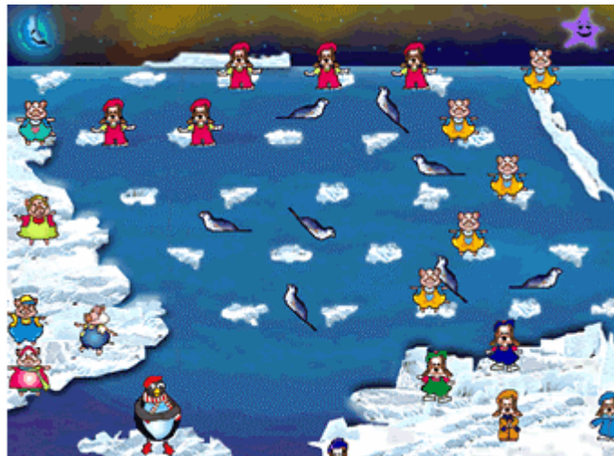
Figura 2b. Interfaces de los juegos, Náufragos en el Polo [op.cit]