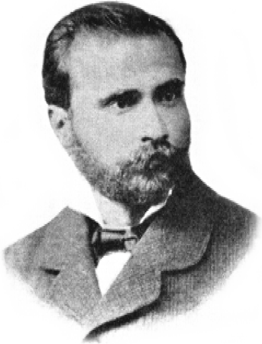
Marco Fidel Suárez.