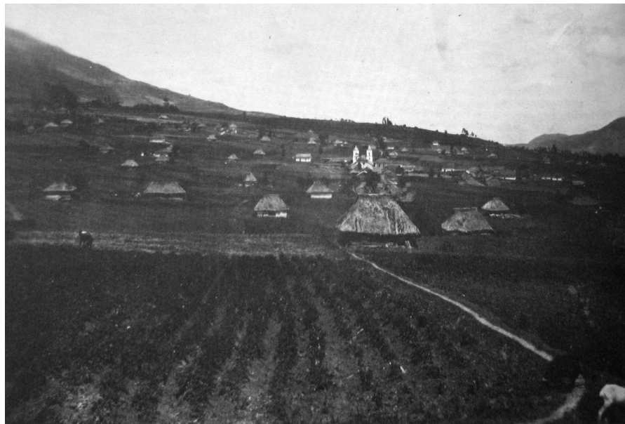
Catambuco 1940

Mediante acuerdos N 031 de diciembre 7 de 1992, Artículos 211, 212, 213 y acuerdo 152 de 04 de 2003 incluidos en el POT pp.188, 189, se establecieron 17 corregimientos que hacen parte de la zona rural del municipio de Pasto, son los siguientes: