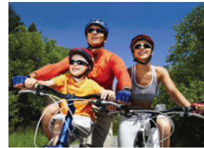
Deportes y recreación