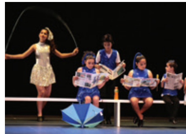
Baile o teatro