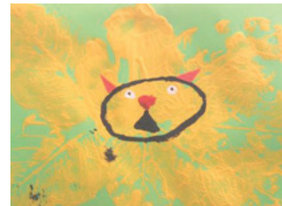
Autor: Santiago Suárez Pinzón Título: León Edad: 8 años