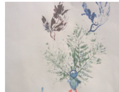
Autora: Mariana Anzola Duarte Título: Pavo real y pájaros Edad: 6 años