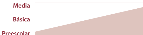
Ilustración 1. Nivel de autonomía en el emprendimiento deportivo

Y la autonomía debe entenderse como “un estado personal en el que ha sido posible construir un punto de vista propio o llevar a cabo una acción voluntaria después de haber considerado las distintas posiciones o posibilidades implicadas en la cuestión tratada (...) La condición esencial de la autonomía es la libertad. La educación no puede estar dominada por una disciplina autoritaria que controle la conveniencia, ni puede estar orientada a la transmisión verbal y a la reproducción memorística del saber” (Puig, 2007:88).