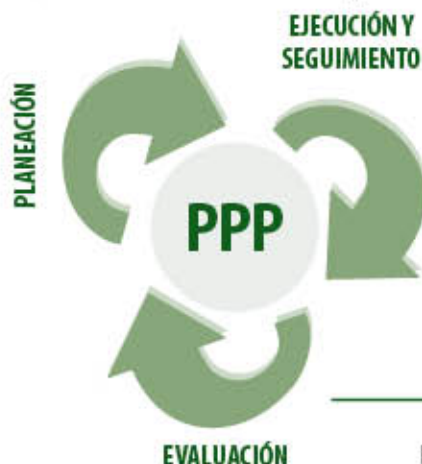
Gráfica No. 5 Fases de los PPP

A continuación se describirá cada una de las fases, sin embargo cabe resaltar que las orientaciones metodológicas, así como los instrumentos de soporte para desarrollar “el cómo” de cada una de las fases señaladas, se explican en el Manual de Formación de Agentes Educativos .