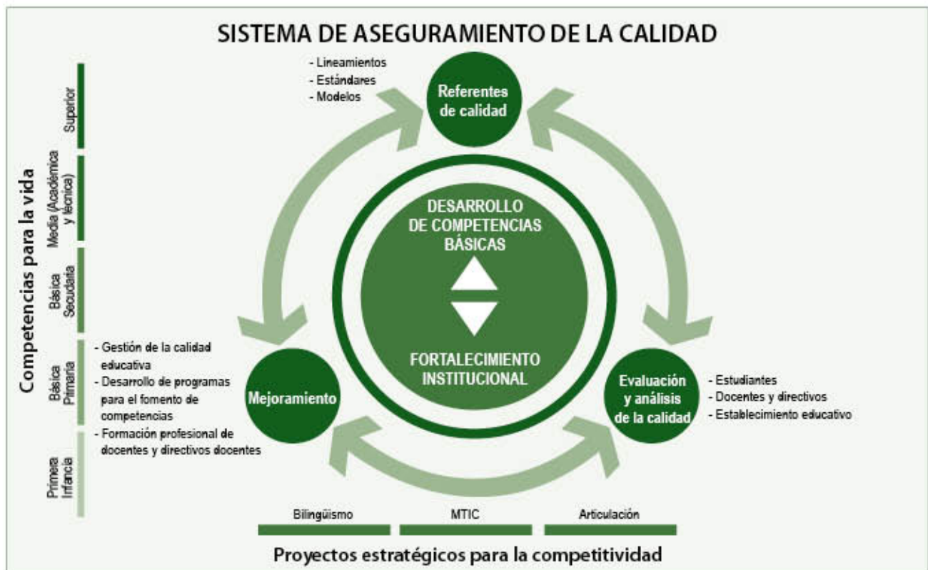
Gráfica No. 1. Sistema de Aseguramiento de la Calidad.