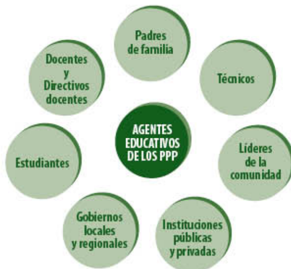
Gráfica No. 6 Agentes educativos de los Proyectos Pedagógicos Productivos

Por último, el desarrollo de los PPP involucra no sólo a directivos, docentes, estudiantes y padres de familia, sino también a actores externos como expertos técnicos, líderes de la comunidad, profesionales de instituciones públicas y privadas, instituciones locales y regionales y organizaciones no gubernamentales.