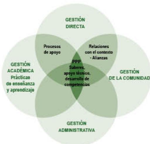
Gráfica No. 4 Prácticas institucionales en las que se materializan los PPP.

Para el Ministerio de Educación Nacional existen cuatro áreas de la Gestión Institucional: directiva, académica, administrativa y de la comunidad todas en constante correspondencia, como se indica en la gráfica No. 4