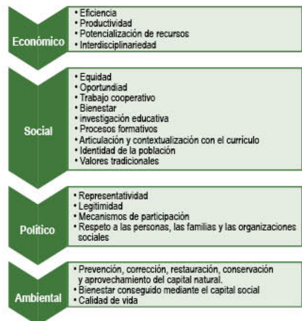
Gráfica No. 3 Alcance de los PPP con respecto al desarrollo humano sostenible

En consecuencia los alcances de los PPP se identifican en la siguiente gráfica: