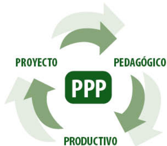
Gráfica No. 2. Componentes de los PPP.

Los componentes de los Proyectos Pedagógicos Productivos, como su nombre lo indica son: el Proyecto , lo Pedagógico y lo Productivo , elementos que se conciben y funcionan de manera interdependiente y complementaria; esto quiere decir que si uno de ellos no es considerado, o existe un desbalance en su énfasis, se corre el riesgo de limitar su alcance o errar en su concepción.