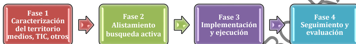
Figura No 2 Fases de la estrategia educativa híbrida

Elaboración propia, Subdirección de Permanencia, Ministerio de Educación Nacional 2020-2021